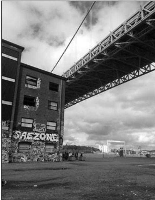
Röda Sten

Seit 2007 organisiert Röda Sten die Internationale Göteborger Biennale für