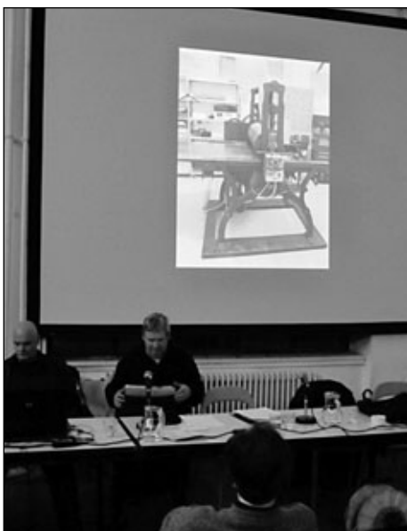
Die Picture Night auf der GV 2012

Stimmberechtigt sind alle (definitiv aufgenommenen) WUK-Mitglieder, die bis spätestens 2 Wochen vor dem GV-Termin – also bis Freitag, 8. Februar – den Mitgliedsbeitrag für 2012 (neue WUK-Mitglieder: jenen für 2013) bezahlt haben. Im Zweifelsfall (die Einzahlung erscheint aus irgendeinem Grund nicht