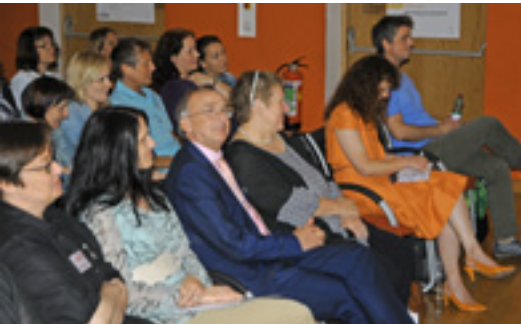
Soziale Ängste sind eine Herausforderung für betroffene Jugendliche, deren Angehörige und Profis in der Beratung. Das zeigte sich auch am großen Interesse an der Fachveranstaltung von WUK CoachingPlus und WUK faktor.i „Spannungsfeld: Soziale Ängste und Jugendliche“ am 16.5.2013 in der Bücherei Philadelphiabrücke.