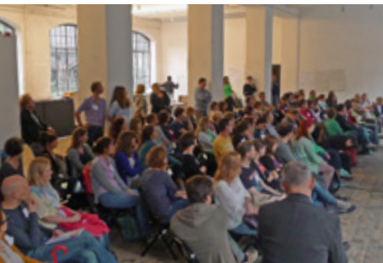
Wie jedes Jahr diskutierten alle Angestellten der WUK Bildungs- und Beratungseinrichtungen beim MitarbeiterInnen-Tag über aktuelle Trends und Herausforderungen.

tes angehören, wurde die strategische Organisationssteuerung nunmehr optimal in der Organisation verankert. Der Strategiekreis arbeitet mit dem im WUK bereits viele Jahre erprobten Werkzeug Balanced Scorecard (BSC). Im Laufe des Jahres 2013 erarbeitete er neue Zielsetzungen, die als Leitlinien für die gezielte Entwicklung der WUK Bildungs- und Beratungseinrichtungen in den Jahren 2014 und 2015 fungieren. Das für die Qualitätssicherung und -entwicklung wesentlichste Vorhaben ist die Implementierung einer wirkungsorientierten Erfolgsmessung in den Angeboten des WUK. Der Strategiekreis steuert und begleitet diesen und weitere strategische Prozesse, er misst die Zielerreichung mit Hilfe eines auf qualitativen und quantitativen Indikatoren basierenden Kennzahlensystems.