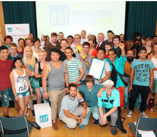
spacelab gewinnt den ESF- Innovationsaward: Im Rahmen einer kleinen Feier zeichnete Bundesminister Rudolf Hundstorfer am 17.6.2013 in der Wiener Urania innovative Beschäftigungs- und Bildungsprojekte aus ganz Österreich aus, die aus Mitteln des Europäischen Sozialfonds (ESF) ermöglicht werden bzw. wurden.