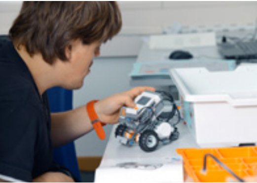
Für den Auftritt von Specialisterne am Pioneer-Festival Ende Oktober 2013 wurden unter anderem eigens Roboter gebaut und programmiert. Ein Vertreter der KursteilnehmerInnen war trotz der Menschenmassen vor Ort mit dabei und half in allen Bereichen mit.