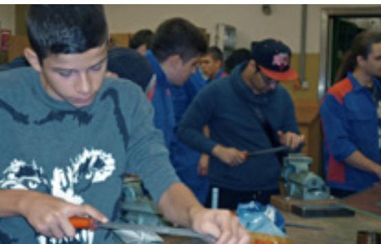
Berufsorientierung wirtschaftsnah: Im Jahr 2013 fanden bei WUK Monopoli vier zweitägige Workshopreihen zu den Berufsfeldern Gastronomie, Metalltechnik, Büro sowie Installations- und Gebäudetechnik statt.