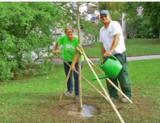
Im Auftrag der Grünen Gänserndorf pflanzte WUK bio.pflanzen einen Baum vor der Gänserndorfer Stadtkirche.

Am 18. Oktober 2013 lud WUK bio.pflanzen zur Präsentation ihrer neuen, naturnah gestalteten Schaufläche ein. Im sozialökonomischen Betrieb, der mittlerweile auf vier Jahre naturnahes Arbeiten zurückblicken kann, werden langzeitarbeitslose Erwachsene aus dem Bezirk Gänserndorf im Bereich der ökologischen Pflanzenproduktion und Gartenpflege beschäftigt und qualifiziert.