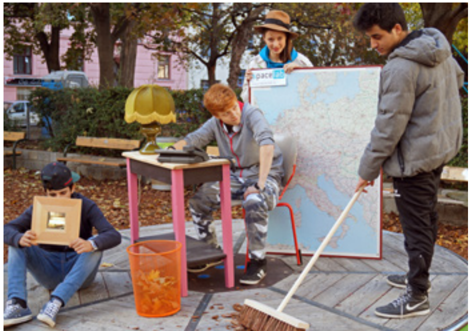
Teilnehmer_innen der Kulturwerkstatt am vierten Standort spacelab_gestaltung inszenieren ein Bild für einen Fotowettbewerb